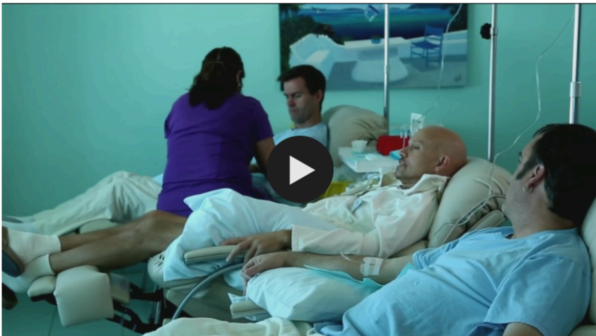
Pacientes de cáncer cruzan la frontera en busca de una cura detrás del muro | Univision

No es la primera vez que una clínica de Tijuana, una ciudad que por años se ha beneficiado del llamado 'turismo médico', es señalada por una presunta mala práctica clínica . De acuerdo a la prensa, varias mujeres han fallecido a lo largo de los años tras someterse a cirugías estéticas allí.