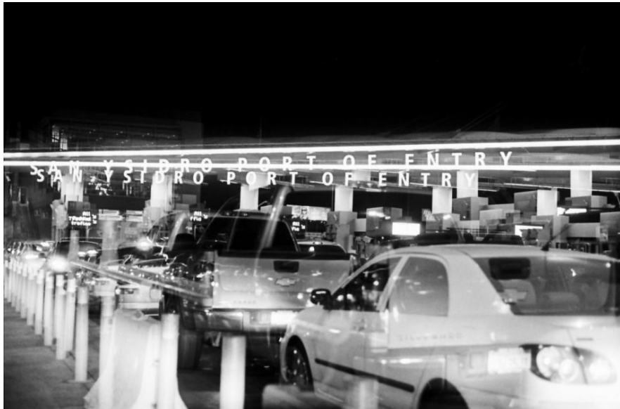
Una foto de la agitada garita fronteriza de San Ysidro, la más transitada del mundo.