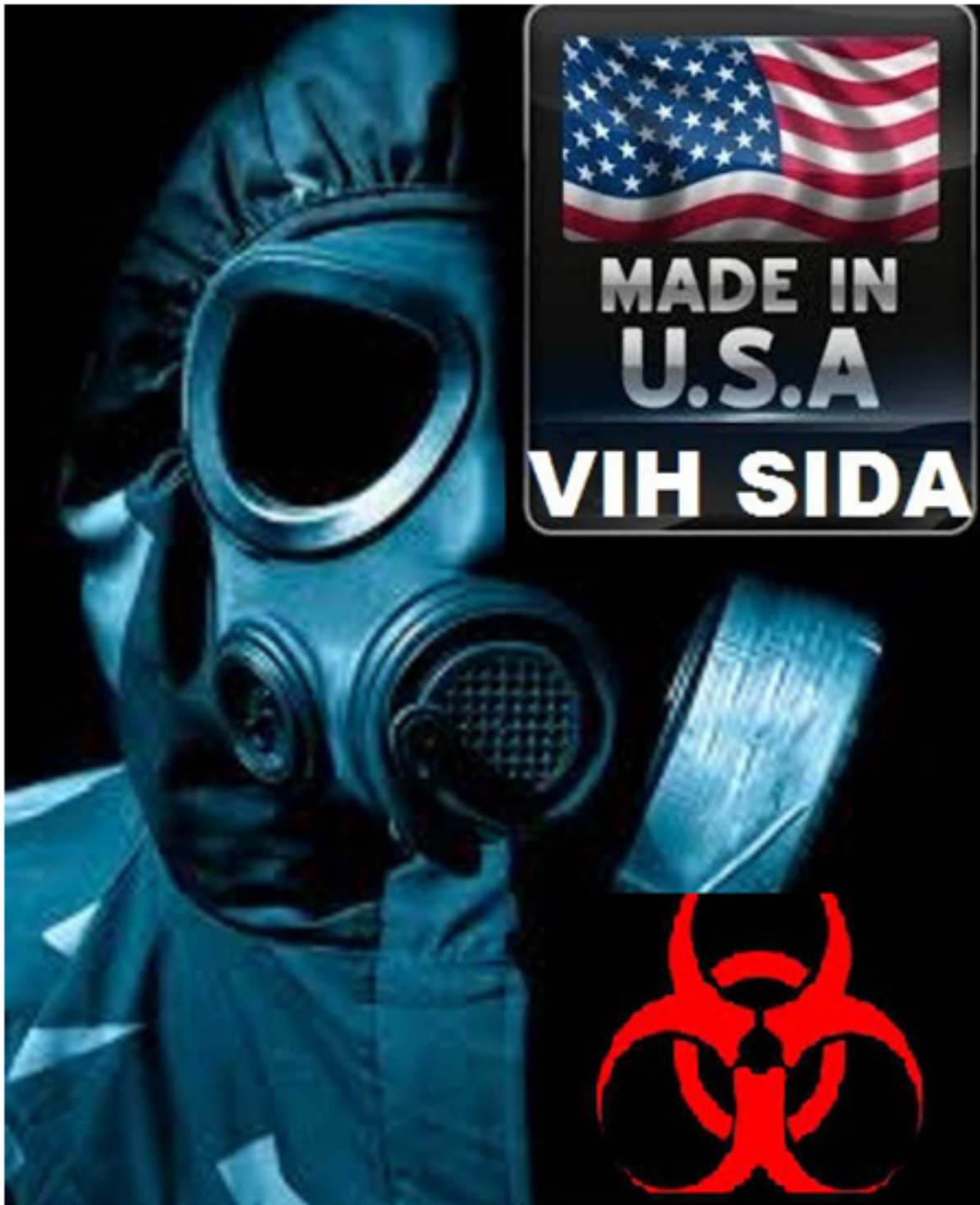
HIV MADE IN USA – Fort Detrick en Maryland EE.UU, en el Laboratorio P4 (P4 Laboratory)